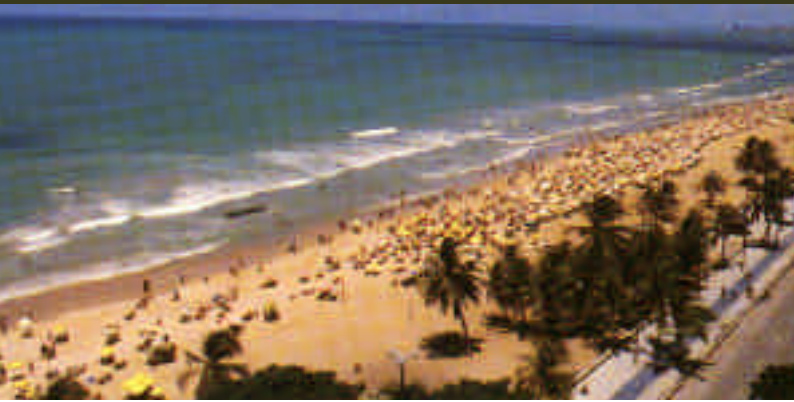
Praia de Boa Viagem, Recife/Pernambuco Boa Viagem's beach, Recife/Pernambuco