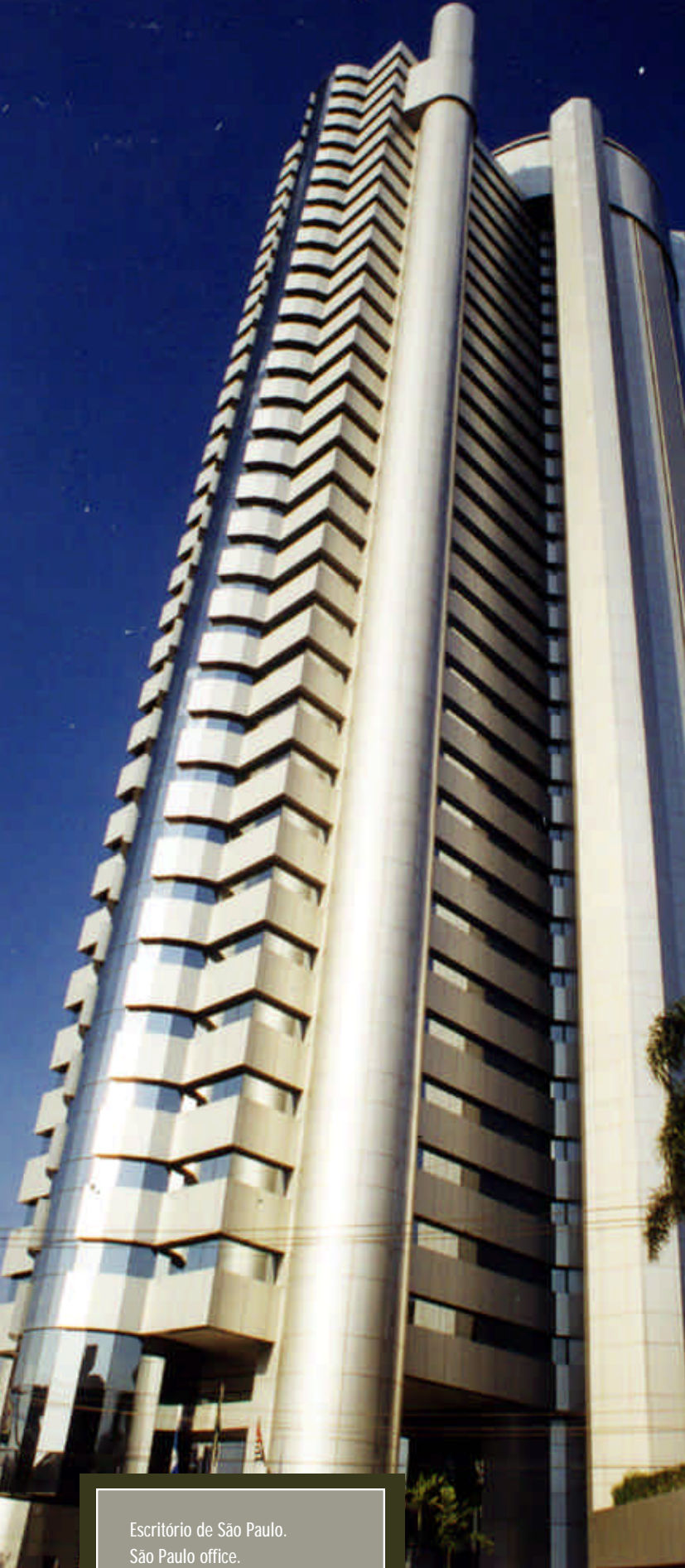
Escritório de São Paulo. São Paulo office.

The practice of Veirano & Advogados Associados is quite diversified and includes the following areas: