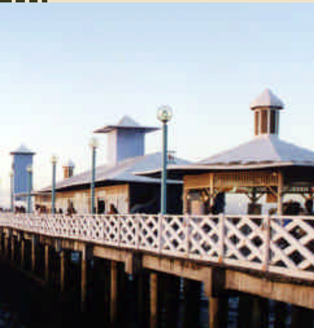
Ponte Metálica, Fortaleza/Ceará