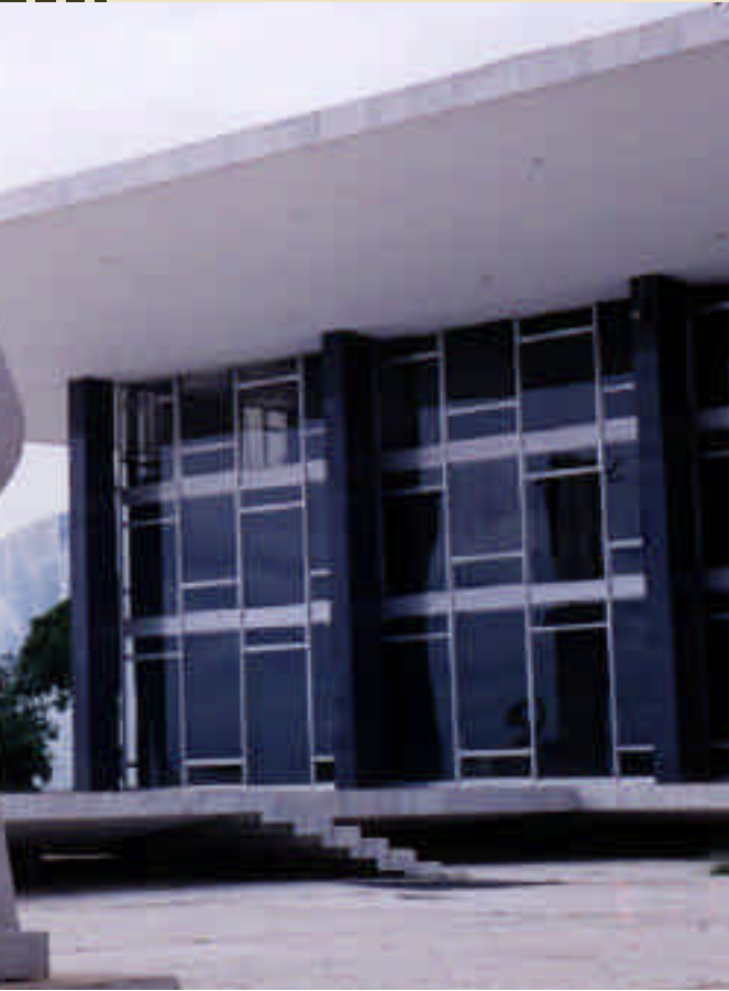
Supremo Tribunal Federal, Brasília/DF