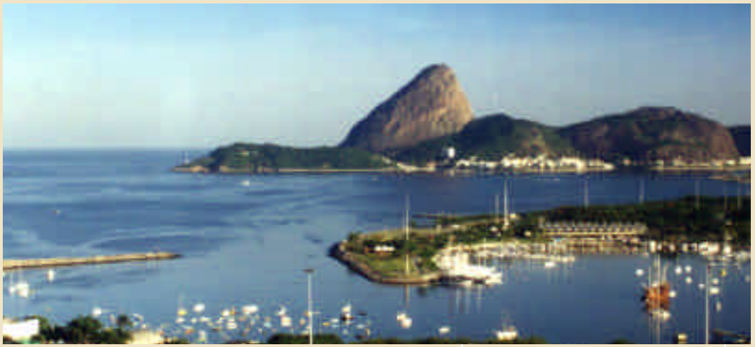
Baía da Guanabara, Rio de Janeiro